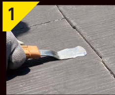
1 屋根材に沿う 使いやすい角度