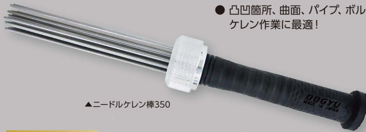
▲ニードルケレン棒350