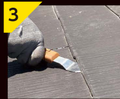
3 スライドさせても 切れます