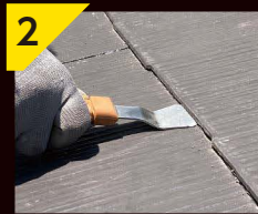
2 差し込んで 隙間を作れます